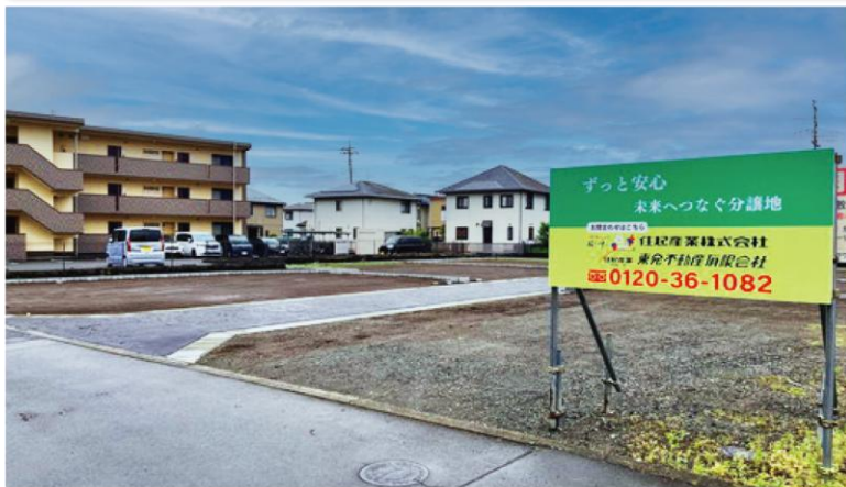
<サンスター裾野市二ツ屋第2期>