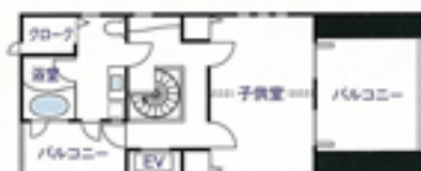
●広々とした玄関ホールの脇にはシューズクローク。そのまま自転車や工具などを置くビットルームへも抜けられる