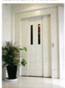
●2人用エレベーターは車椅子の主な乗車可能な広さ。地震製製造転載置付きの安心設計

家の各所には、さまざまなカタチのスリット型サッシを用いることで、四方から効率よく採光と通風も確保している。極めつけは最上階のバスルーム。デザインスタイルを使ったサニタリーとワイドサイズのファミリアバスは、家族を癒してくれる極上のリラクسسスペースだ。